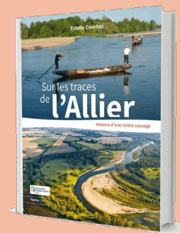
Photo : "Sur les Traces de l'Allier" - 36€ - disponible au CEN Allier et en librairie

Informations auprès du CEN Allier - 04.70.42.89.34