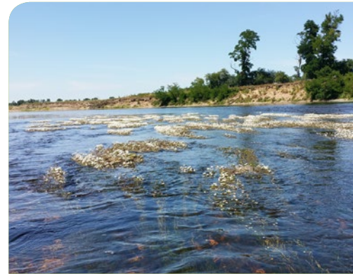
Herbier à renoncules CEN Allier