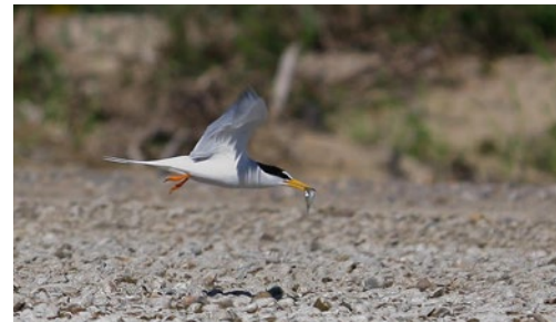
Sterne naine en vol A. Bayle