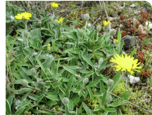
L'Épervière de Loire, spécifiquement liée à la Loire, est protégée au niveau régional L. Poncelet Quintard