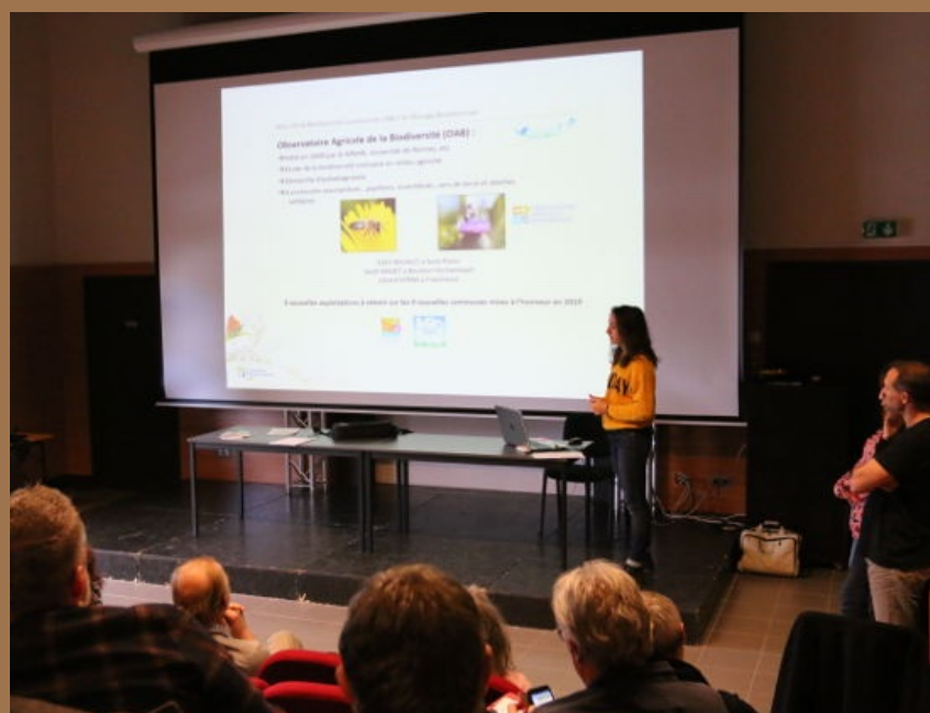
Photo : Présentation lors de la journée d'échanges © J-P DOMINGUES

Depuis de longues années, le Conservatoire travaille en partenariat avec de nombreux éleveurs sur les bords d'Allier pour la préservation et l'entretien de milieux ouverts sur et autour du Domaine Public Fluvial (DPF). Pratiqué de manière extensive, l'élevage permet l'entretien de milieux naturels riches en biodiversité, contribue à la préservation d'une mosaïque paysagère typique du Bourbonnais (gestion des haies et des zones herbagères, limitation de l'embroussaillage du DPF et des grèves) et au maintien de zones d'écoulement des eaux lors des épisodes de crues.