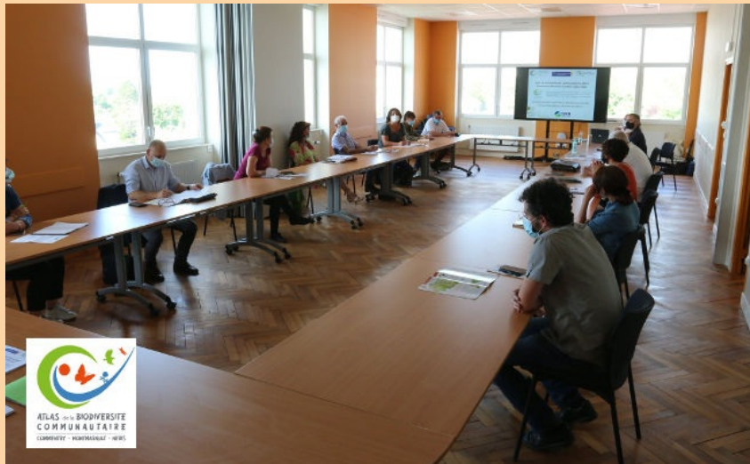
Photo : Premier comité de suivi du projet

Et pour introduire le projet, une première réunion publique a été organisée à Néris-les-Bains, suivie de la projection du film de Frank PIZON "De Nature Bourbonnaise". Le lendemain s'est tenu le premier Marathon naturaliste qui a connu un vif succès avec une trentaine de participants et plus de 300 espèces de la faune et de la flore inventoriées sur une exploitation agricole de la commune de Venas.