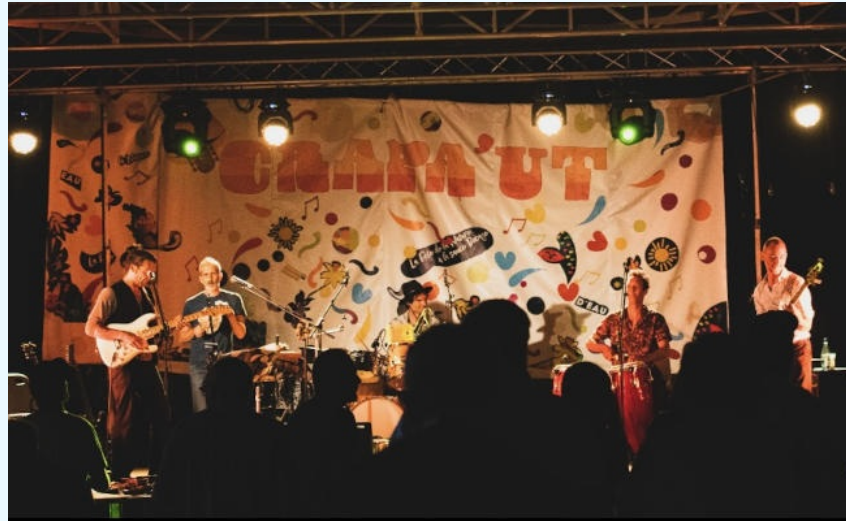
Photo : Festival Crapa'ut © Communauté de communes du Bocage Bourbonnais