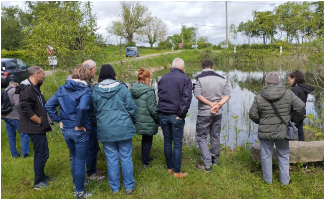
Photo : Découverte de la mare de Blomard restaurée lors de l'ABC

Retrouvez les Lisettes électroniques précédentes en cliquant ci-dessous