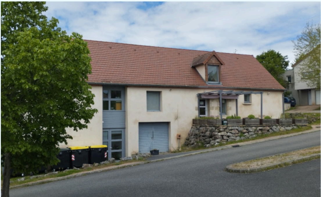
Photo : Siège du CEN Allier à Châtel-de-Neuvre

Un grand merci à la commune de Châtel-de-Neuvre, propriétaire de la maison des associations où siège le CEN Allier, qui a financé les travaux nécessaires.