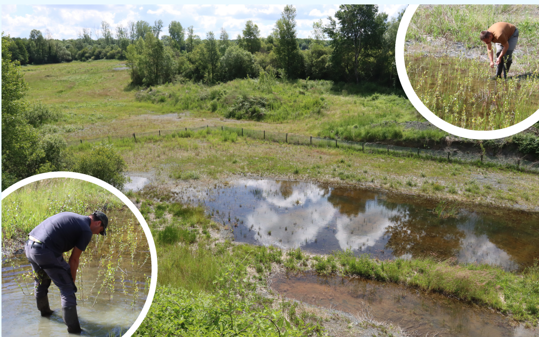
Photo : Arrachage des repousses de ligneux

Retrouvez les Lisettes électroniques précédentes en cliquant ci-dessous