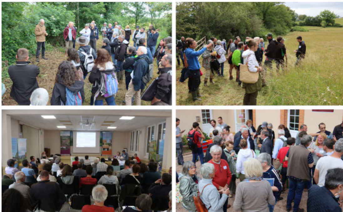
Photo : Extraits de l'Assemblée générale

Un grand merci à tous les participants qui ont contribué à la réussite de cette belle journée, ainsi qu'aux propriétaires du domaine des Sirets pour leur accueil. Une petite vidéo sera prochainement partagée pour vous faire revivre, comme-ci vous y étiez, les moments forts de cette Assemblée générale.