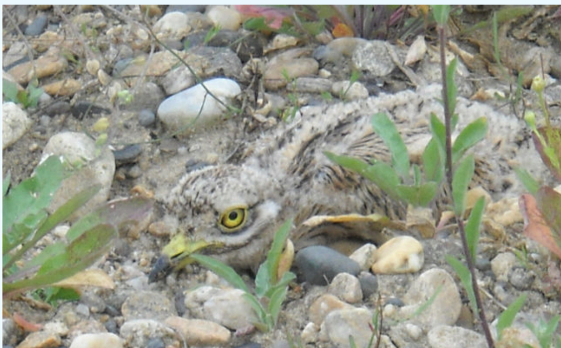
Photo : Jeune œdicnème criard, mimétique parmi les galets

Retrouvez les Lisettes électroniques précédentes en cliquant ci-dessous