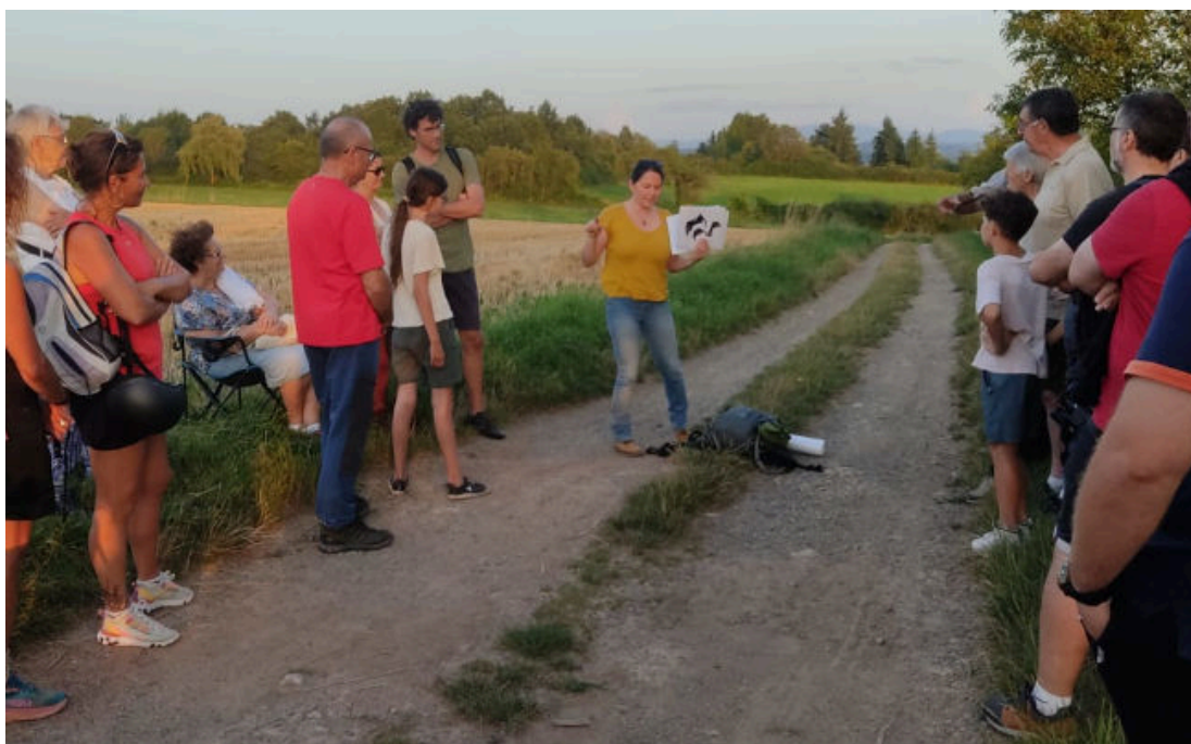
Photo : Animation par Chauve-Souris Auvergne © CEN Allier - G. THEVENARD

La période de reproduction 2024 des chauves-souris s'achève. Les jeunes sont désormais émancipés et se dispersent dans le paysage avec le reste de leur colonie pour se confectionner les réserves de graisse indispensables à leur future hibernation. Bientôt arrivera la saison des accouplements qui a lieu à la fin de l'été. Les femelles conserveront intact le sperme du mâle en attendant une fécondation au printemps qui