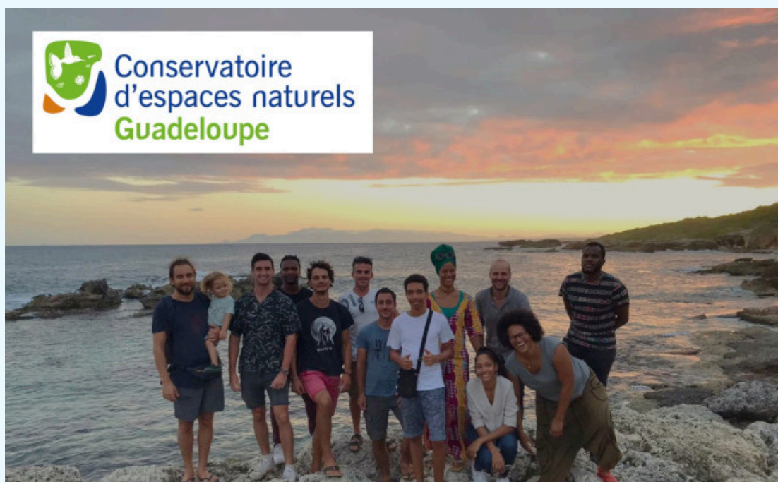
Photo : Conseil d'administration du CEN Guadeloupe

Retrouvez les Lisettes électroniques précédentes en cliquant ci-dessous