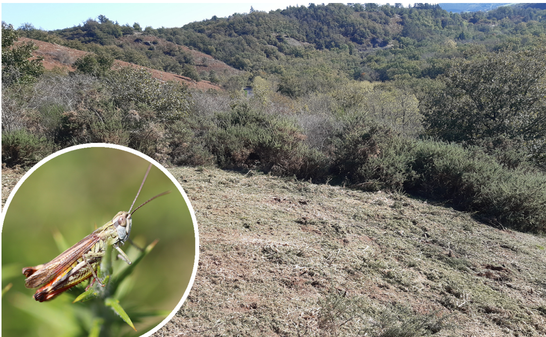
Photo : Gestion des landes à ajoncs © CEN Allier - J. MAINAUD / R. DESCHAMPS

Retrouvez les Lisettes électroniques précédentes en cliquant ci-dessous